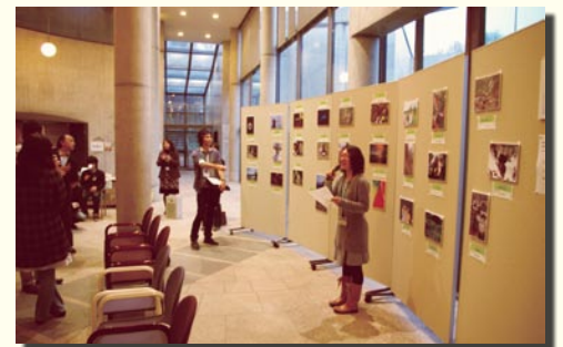
フォトコンテスト表彰式

応募された27作品の中から4作品を受賞作品として選出し、その中から2作品を紹介します。表彰式は発表会後の懇親会にて行いました。なお、このフォトコンテストは首都大学東京 生命科学コースの学部生らによって運営されました。