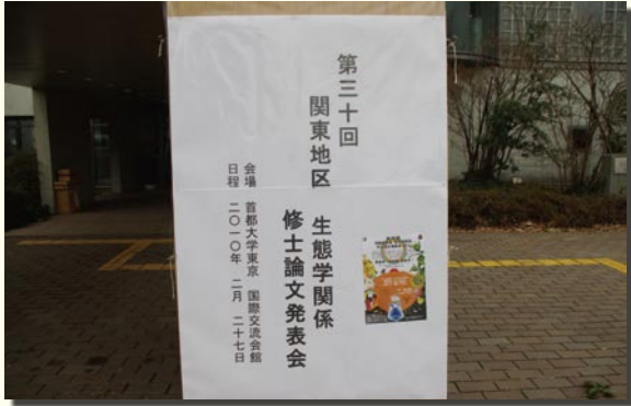
発表会場：国際交流会館前

2010年2月27日、首都大学東京 南大沢キャンパス 国際交流会館にて、第30回 関東地区 生態学関係 修士論文発表会が開催され、79名が参加しました。発表後の懇親会には31名が参加しました。