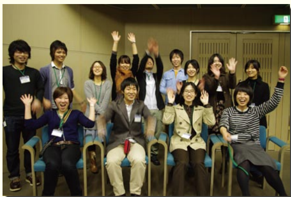
2010年運営委員とスタッフ